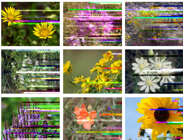
1. Falsa margarita